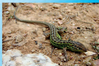
Sargantana cendrosa (Psammodromus edwardsianus, ~ P. hispanicus) Al Parc Natural hi ha la població més important del litoral gironí