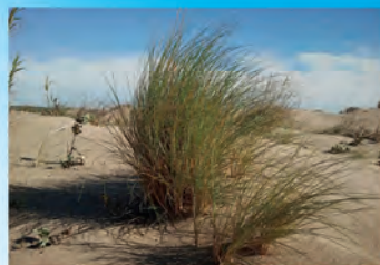
Borró (Ammophila arenaria) Fixadora d'arenals