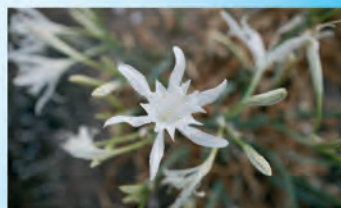
Lliri de mar (Pancratium maritimum) Emblema de la flora litoral