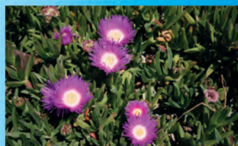
A les dunes litorals del Parc s'han detectat NOU espècies de flora exòtica. Cal eradicar-les perquè representen una pèrdua en la biodiversitat i el funcionament de les dunes. L'exemple més vistós és l' uncla de gat ( Carpobrotus sp.)

Parc Natural del Montgrí, les Illes Medes i el Baix Ter Passeig del Port, s/n · 17258 L'Estartit Tel. 972 75 17 01 · Fax. 972 75 20 04 pnmbt@gencat.cat www.gencat.cat/parcs/illes_medes